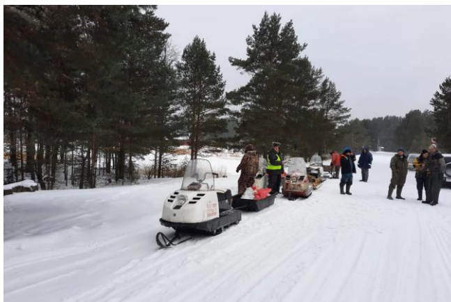
Проведение рейдового мероприятия «Снегоход»

Всего за 2021 год в рамках контрольно-надзорной деятельности составлено 380 административных материалов (в 2020 году – 667), сумма наложенных штрафов по которым составила 732, 55 тыс. руб.