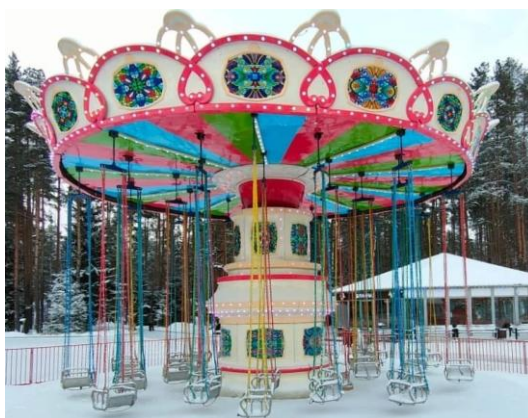
Аттракцион «Цепочная карусель» на территории курорта «Охта Парк»

2. Проведена разъяснительная работа с эксплуатантами аттракционов в части соблюдения безопасности и эксплуатации аттракционов в рамках ответов на обращения по телефону, а также письменных обращений.