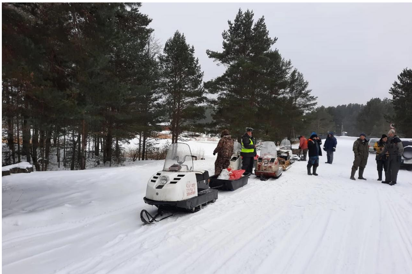
Проведение рейдового мероприятия «Снегоход»

2) Совместно с заинтересованными контрольно - надзорными федеральными органами исполнительной власти и органами исполнительной власти Ленинградской области в период проведено 14 плановых рейдовых мероприятий: «Снегоход», «Профилактика», «Квадроцикл», «Частник», в ходе которых проверено 353 единицы техники, выявлено 90 самоходных машин, эксплуатировавшихся с нарушениями обязательных требований, влияющих на обеспечение безопасности для жизни, здоровья людей, окружающую среду и безопасность движения.