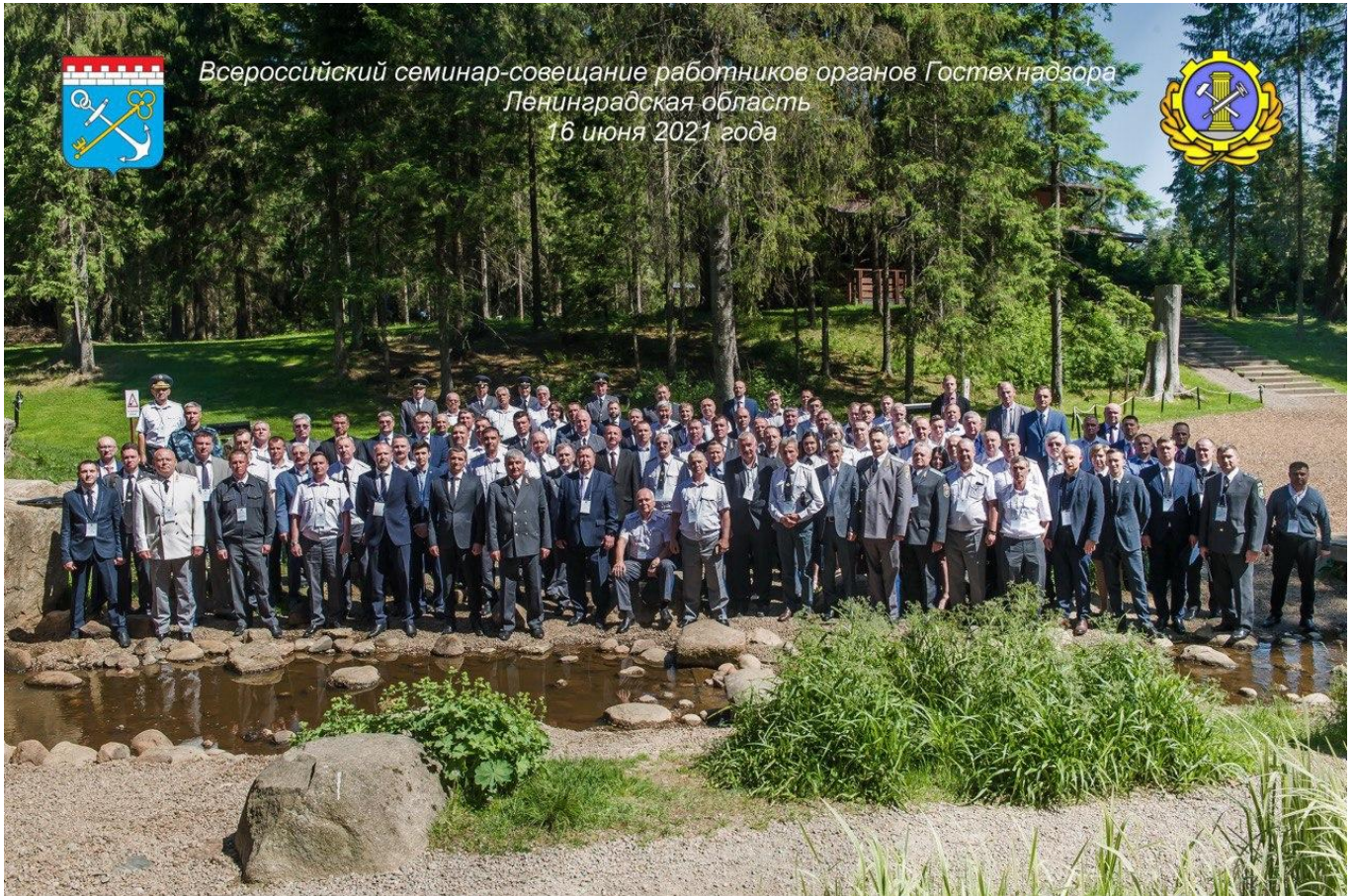
Участники Всероссийского семинара-совещания

семинар-совещание работников органов Ростехнадзора по теме: «О реализации норм законодательства, регламентирующей деятельность органов Ростехнадзора», в