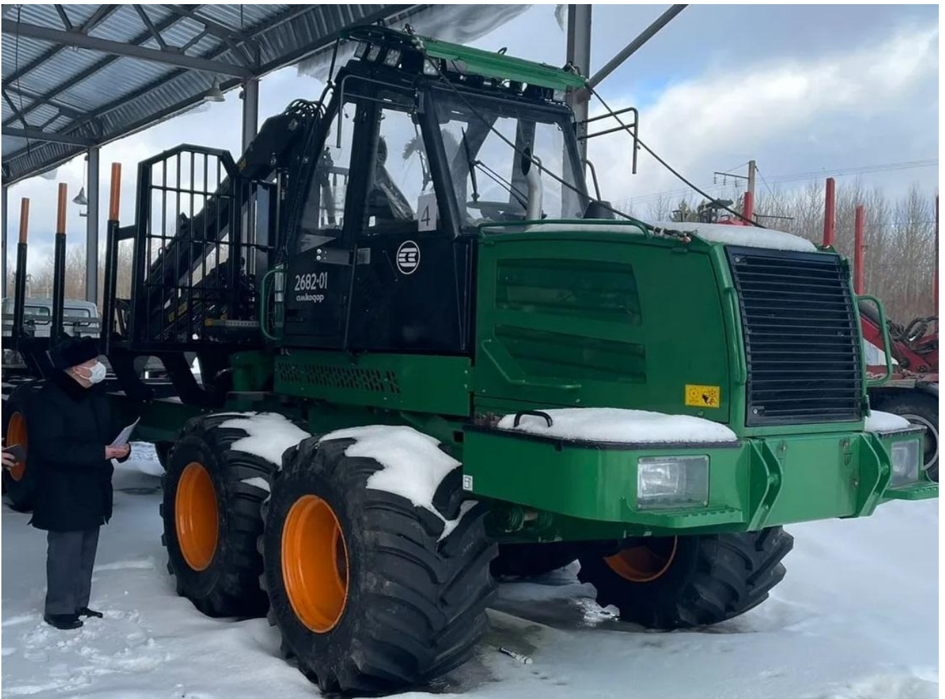
Проведение технического осмотра инженером-инспектором Гостехнадзора

Поставленные задачи в 2021 году выполнены. Достигнут показатель 50,5% представленных на технический осмотр самоходных машин от общего числа зарегистрированной техники, что в числовом выражении составляет 16747 ед.