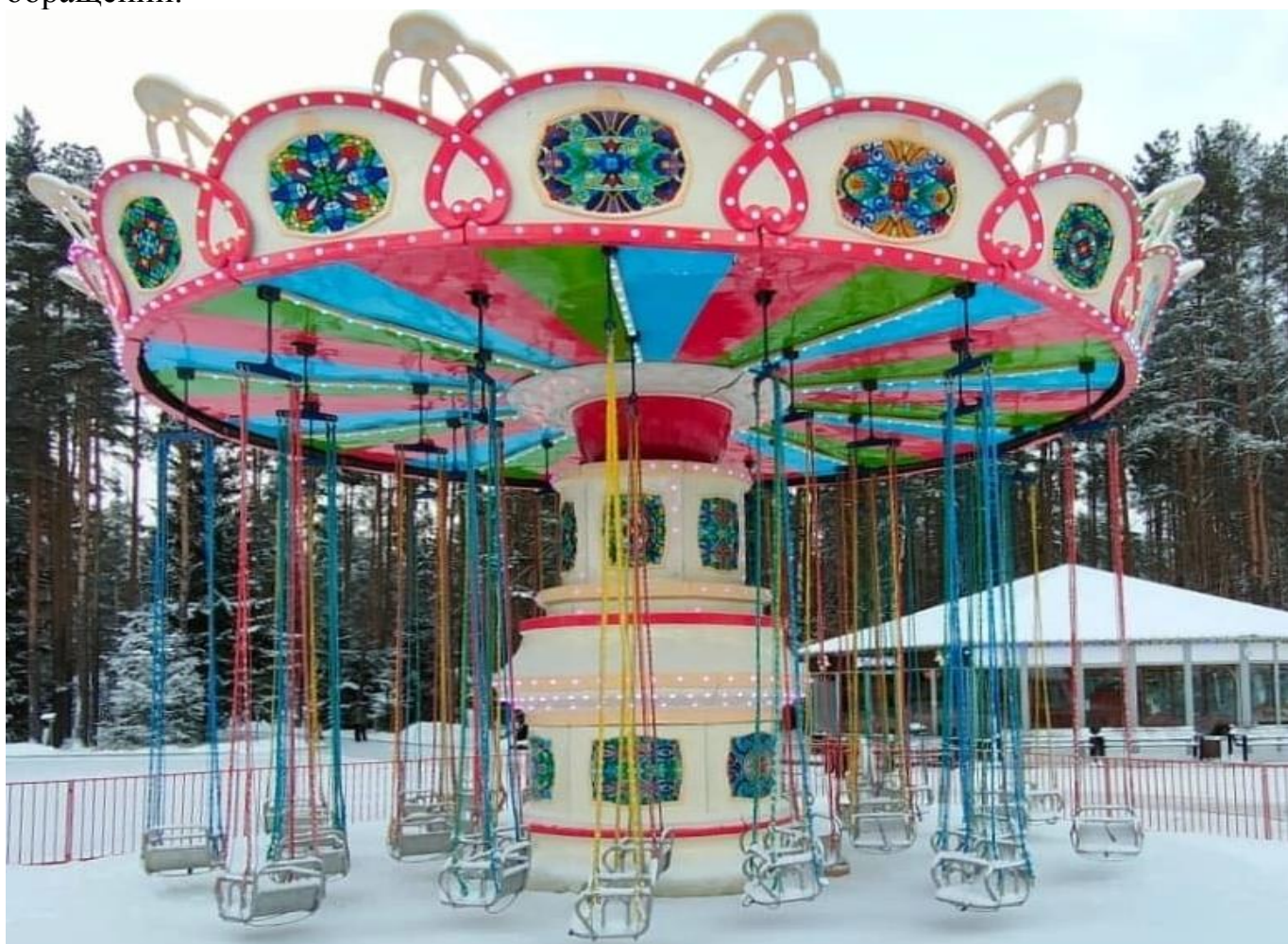
Аттракцион «Цепочная карусель» на территории курорта «Охта Парк»

В течение года на постоянной основе велась разъяснительная работа с эксплуатантами аттракционов в части соблюдения безопасности и эксплуатации аттракционов в рамках ответов на обращения по телефону, а также письменных обращений.