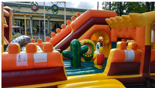
Подлежащий надзору объект

Новым направлением деятельности Управления в 2020 году стал региональный государственный надзор за аттракционами. По результатам совместной работы с Администрациями муниципальных образований Ленинградской области установлено, что в период весна – осень на территории